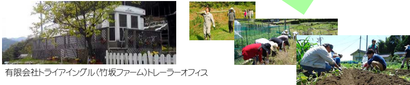
有限会社トライアングル(竹坂ファーム)トレーラーオフィス