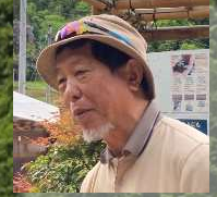
出口アドバイザー