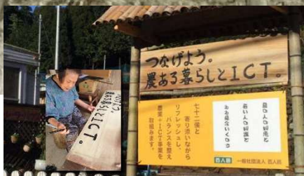
↑事業所の看板は、10年前、当初予算がなく、現在、93歳の母が手書きで制作した看板です。